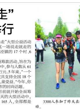
3300人参加了昨天在枫泾古镇举行的“一个鸡蛋的暴走”活动。

低的要求,有民生银行、农业银行、汇丰银行、友利银行等,但九厘无一例外对享受优惠折扣的低利率房贷客户都有附加条件的要求。比如民生银行首套房利率可以最低